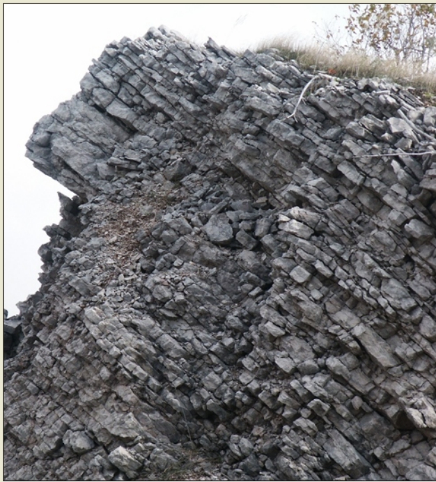
Boundstone algaire lité, gris à gris-rouge, et bafflestone algaire en monticules, gris foncé, de la formation de Gays River, provenant d'une carrière située près de Havelock, dans le sud-est du Nouveau-Brunswick.

Brunswick, ainsi que près de Petitcodiac et de Hillsborough dans le sud-est du Nouveau-Brunswick. Du point de vue de la qualité, le calcaire de Macumber peut être classé en tant que roche uniforme à teneur moyenne, renfermant jusqu'à 52 % de CaO. Pour ce qui est des possibilités de mise en valeur, la formation de Macumber présente rarement une épaisseur de plus de 18 m et l'abondance des ressources est limitée dans la majorité des endroits. Mis à part le fait qu'il s'agit d'une source possible de calcaire à forte teneur en calcium, la stratification en couches laminées unique de Macumber en fait un matériau recherché pour les dalles et diverses utilisations comme pierre de construction et d'aménagement paysager. Des accumulations algaires riches en calcium (boundstone) sont aussi présentes, par endroits, à l'intérieur de la formation de Parleeville. Un affleurement de plusieurs kilomètres à l'ouest de Sussex laisse supposer que ces types de structures algaires sont plus petites et beaucoup moins étendues que celles associées aux strates de Gays River et qu'elles sont fréquemment liées à des quantités variables de roches sédimentaires silicoclastiques qui réduisent substantiellement la qualité du calcaire. En général, les strates calcarifères de Parleeville offrent un potentiel très limité de mise en valeur comme source de calcaire ou de dolomie calcaire riche en calcium.