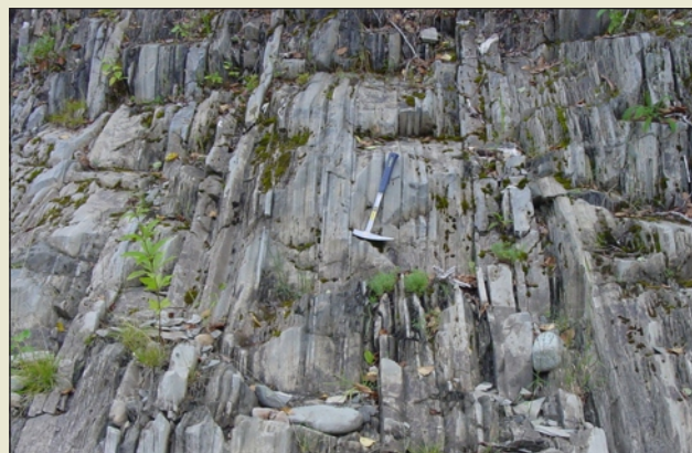
Calcaire argileux à cristallin, à grains très fins, massif à stratifié, généralement gris foncé à gris bleuâtre, régulièrement interlité avec des quantités variables de schiste calcareux de la formation de White Head, dans le nord du Nouveau-Brunswick.

Dans le sud-ouest du Nouveau-Brunswick, en quelques endroits le long du littoral de la baie de Fundy à l'ouest de St. George, la formation de l'Ordovicien tardif de