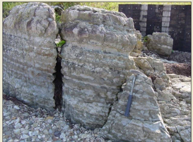
Calcaire fortement fossilifère, noduleux se transformant en strates minces, gris de la formation de La Vieille, à l'ouest de Belledune au bord de la baie des Chaleurs, dans le centre-nord du Nouveau-Brunswick.

Les roches carbonatées du groupe de Windsor se répartissent dans la région en trois formations latéralement équivalentes : les formations de Parleeville, de Gays River et de Macumber. Parmi les trois, le calcaire de Gays River est le plus recherché comme source potentielle de roche à forte teneur en calcium et, par endroits, à forte teneur en magnésium. Les accumulations de carbonate algaire (boundstone) épaisses (jusqu'à 30 m), à stratification irrégulière, et le calcaire lité intraclastique (wackestone) prédominant à l'intérieur de la formation ont généralement une teneur variant entre 52 et 54 % de CaO. Les ressources considérables de calcaire de Gays River sont étendues près de Havelock, à l'ouest de Moncton. La formation de Macumber est une séquence de calcaire (packstone) à stratification parallèle, en strates minces, comportant un mélange de carbonate arénacé, argileux et riche en calcium. D'excellents affleurements sont visibles près d'Upham, à une trentaine de kilomètres au sud-ouest de Sussex, à Sussex Corner, dans le centre-sud du Nouveau-