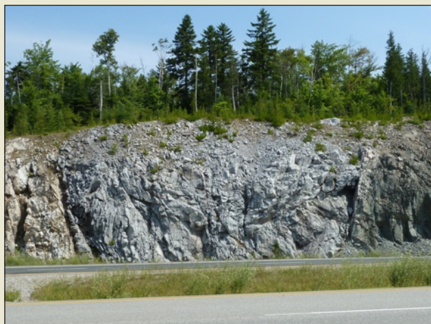
Calcaire et calcaire dolomitique de la formation d'Ashburn près de French Village, dans le centre-sud du Nouveau-Brunswick.

représentent les ressources en calcaire et en dolomie les plus âgées et les plus vastes au Nouveau-Brunswick. Le groupe de Green Head est divisé en deux formations. La formation d'Ashburn abrite d'importants gîtes carbonatés de calcaire et de calcaire dolomitique associés à des quantités variables d'argilite et de quartzite. La formation sus-jacente de Martinon est une séquence épaisse de brèche calcaire et de siltite siliceuse.