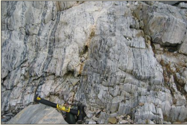
Calcaire en strates minces, gris, de la formation de Goss Point, à Letang, au sud de Saint George, dans le sud-ouest du Nouveau-Brunswick.

(groupe de Meductic) abrite des dépôts de calcaire cristallin et lithographique sous la forme de lentilles s'insérant à l'intérieur de quartzite et d'argile calcareuse. Les strates de calcaire sont déformées de façon complexe, présentent une inclinaison moyenne à prononcée, et sont boudinées et cisailées, ce qui engendre des gîtes isolés et modestes d'une étendue latérale et verticale limitée. La plupart de ces dépôts sont habituellement siliceux et ont de faibles teneurs de MgO, renfermant de 35 à 55 % de CaO.