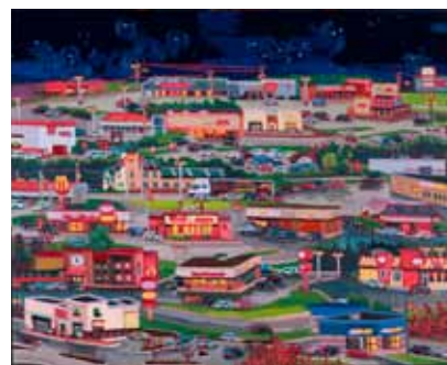
Jack Bishop, Drive-Thru Landscape / Paysage-restaurants à service rapide, 2009