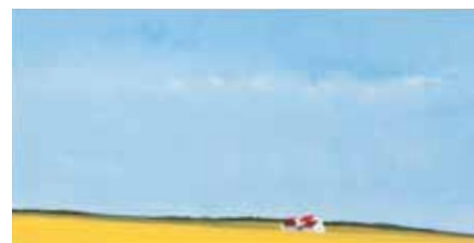
Hendrik Gringhuis, Yellow Field / Champs jaune, 2010