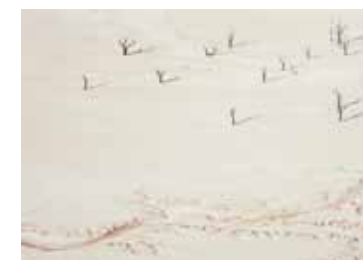
Freeman Patterson, On the Shore of the Lake That Was #1 / Sur la berge d'un ancien lac (image n° 1), 2010

L'artiste appelle ces images « les fantômes de ses voyages », reflets de moments éphémères comme le « clic » d'un appareil photo – une infime fraction du temps qu'il faut pour regarder quelque chose qui passe. L'appareil ne pouvant capter l'image, il la brouille. Idée : Pensez à la citation d'Ansel Adams : « Il y a toujours deux personnes dans chaque photo : le photographe et l'observateur. »