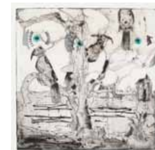
Yvon Gallant, Ice Cream / Crème glacé, 2008

Recourant au processus de la monogravure , l'artiste explore la nature en détresse et la matière végétale et biologique dans un état altéré. Idée : Créez une œuvre d'art représentant la dégradation de l'environnement.