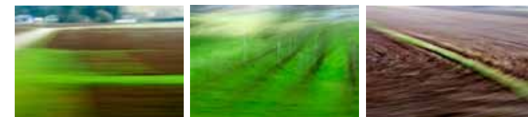
Mathieu Léger, Untitled (Graz-Koppling-Barnbach-79/92/100) / Sans titre (Graz-Koppling-Barnbach - 79/92/100), 2009.

L'artiste est influencé par la culture populaire – l'ensemble d'idées en constante évolution qui caractérisent les désirs, les besoins et les éléments culturels. Il se sert de l'échelle, de la répétition et de la couleur pour représenter la vie urbaine contemporaine. Idée : Représentez la culture populaire dans une œuvre d'art.